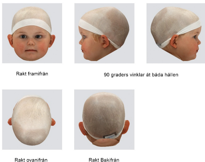
Figur 2 Standardvinklar vid kraniofotografering. Mössa behövs inte vid fotografering, men om barnet har mycket hår är det bra att fukta det innan fotografering så skallformen framträder tydligt.